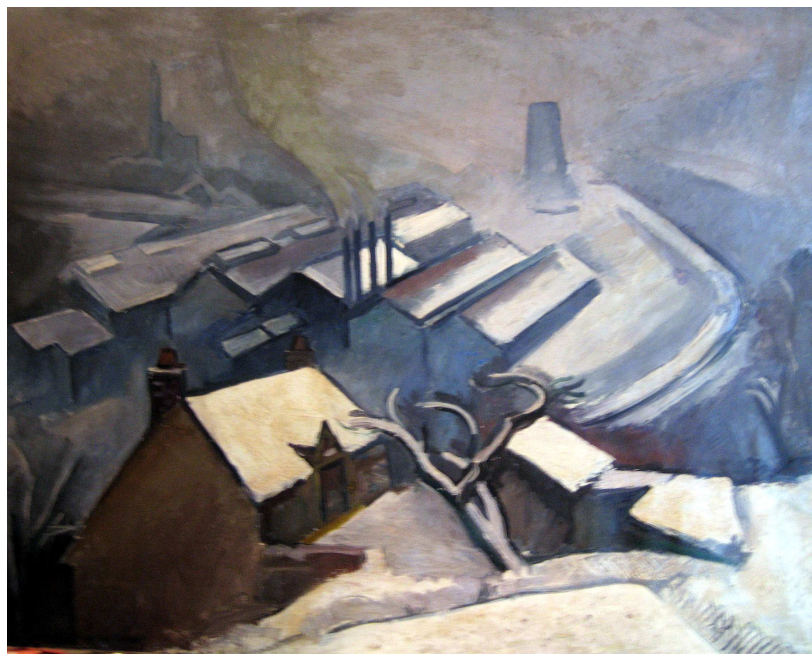
Usines sous la neige vues du chemin des Dames. 26 janvier 1950.

Cinémage – BP 20094 – 71206 Le Creusot cedex associnémage@yahoo.fr – cinémage.asso.fr